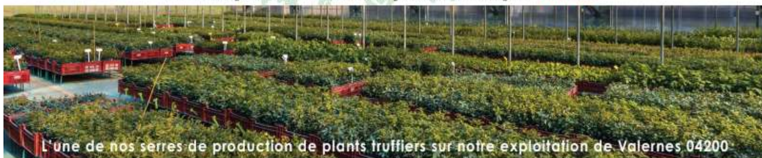
L'une de nos serres de production de plants truffiers sur notre exploitation de Valernes 04200

• Livrés après contrôle de mycorhization par INRAE